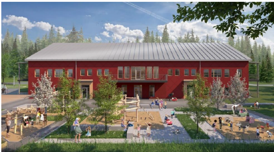
Vy över förskolegården med Mörtsjövägen i söder bakom förskolebyggnaden.

Förutsatt att man kan samnyttja parkering på grannfastigheten Kiselstenen 1 och att leveranser sker på Mörtsjövägen så är bedömningen att en friyta om cirka 38 kvm per barn kan uppnås.