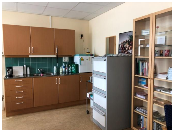
Skolsköterska, bild 2