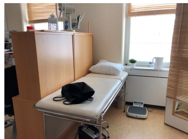
Skolsköterska, bild 3