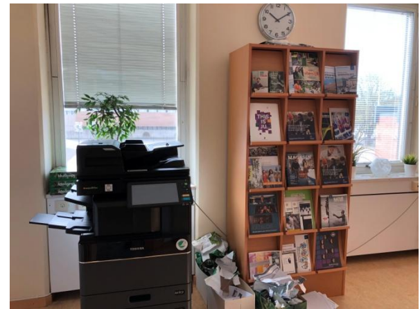
Studieväglädningsrum, bild 2