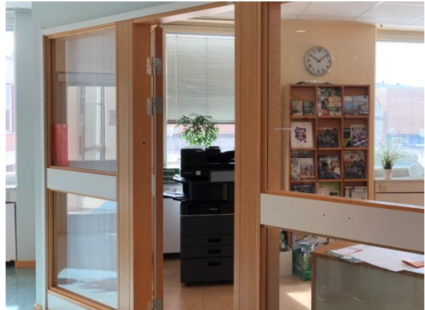
Entrérum / Studieväglädningsrum