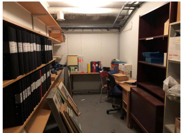
Arkiv, bild 2