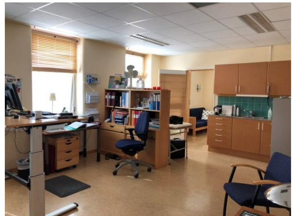
Skolsköterska, bild 1