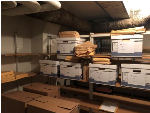
Arkiv, bild 1