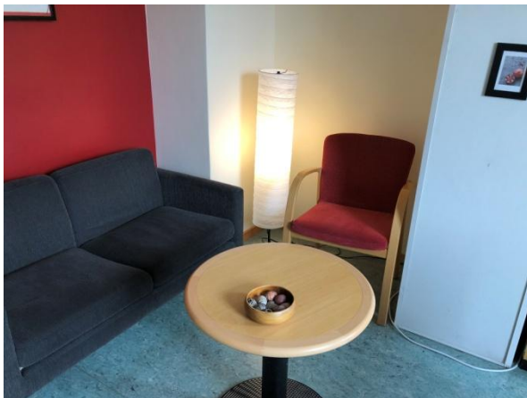
Skolkurator, bild 2