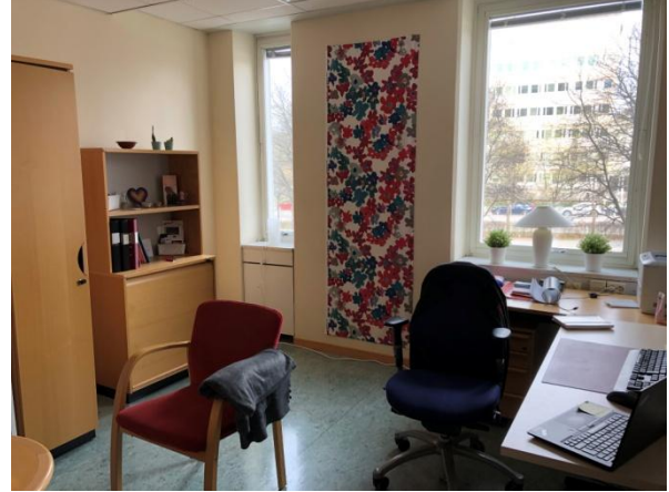
Skolkurator, bild 1