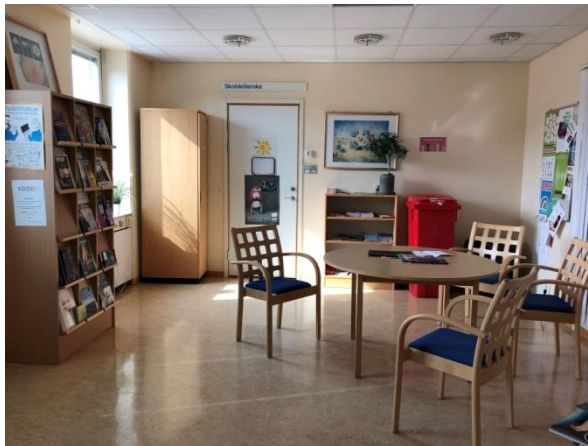
Studieväglädningsrum, bild 1