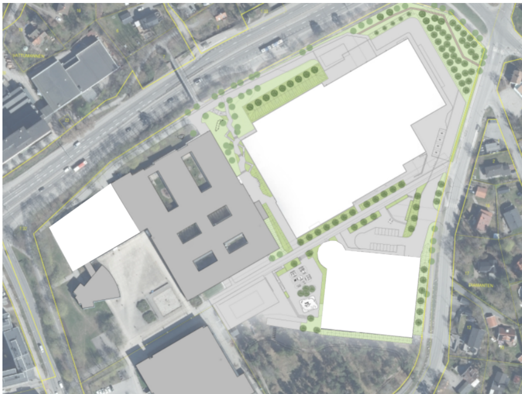
Illustrationsplan över möjlig utformning, Wii Landskap.

Detaljplanen syftar till att möjliggöra byggnation av en ny simhall samt flertalet hallar för diverse idrottsfunktioner ( Nya Huddingehallen ). Detaljplanen syftar också till att möjliggöra utveckling på platsen utan att en övergripande omvandling av gymnasieområdet hindras. I arbetet kommer även andra möjliga funktioner studeras exempelvis bostäder och kontor.