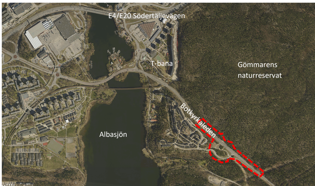
Figur 1: Flygfoto över berört område. Upphävandets ungefärliga avgränsning markerat i rött.

Syftet med att upphäva del av den gällande detaljplanen för Haga VII är att möjliggöra för Trafikverkets vägplan för Tvärförbindelse Södertörn. För att Trafikverket ska kunna fastställa vägplanen krävs det att vägplanen inte strider mot gällande detaljplaner.