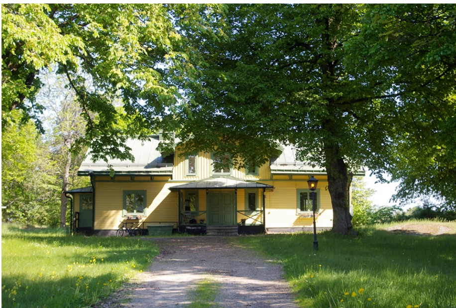
Länna gästgiveri från 1600-talet

Fastigheterna Korallroten 16 och 17 föreslås få en byggrätt för villabebyggelse i form av småhus, byggnaderna uppförs med hänsyn till kulturmiljön där Länna gästgiveriet är belägen.