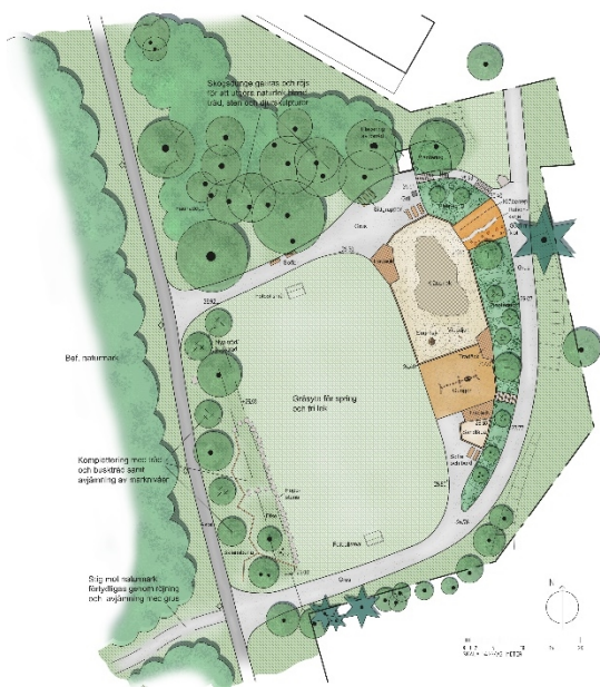
Förslagsskiss för ny utformning

Med i projektgruppen för parkupprustningen deltar representanter från stadsmiljöavdelningens parkenhet, miljö- och bygglovsförvaltningen.