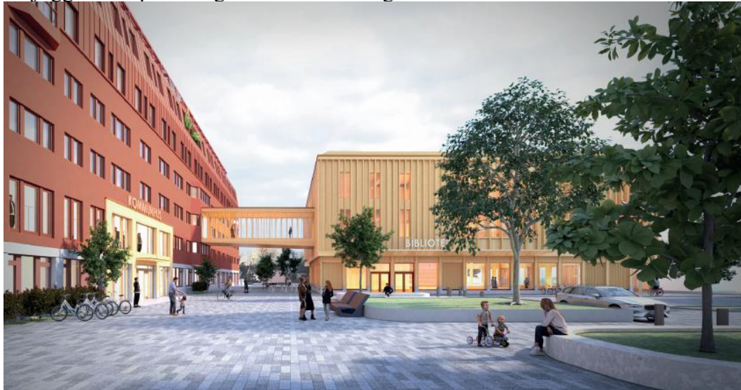
Figur 2 Vy från planområdets norra del med Huddinge centrum i ryggen. Bild: White arkitekter AB

Biblioteksbyggnaden föreslås byggas under med ett garage i en våning, för att möjliggöra för parkering i direkt anslutning till kommunhus och bibliotek.