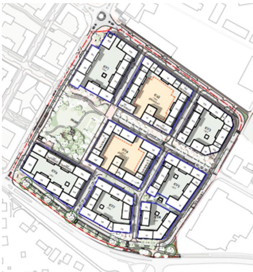
Situationsplan över detaljplaneområdet. Kvarter 2 och 4 med gulmarkerade ytor markerar planerade förskolegårdar.

Planens syfte är att tillskapa en bra boendemiljö med stora möjligheter att tillhandahålla service och rekreation i närområdet. Bebyggelsen ska möjliggöra en trivsamt och hälsosamt livsmiljö. Nya lokalgator, gång- och cykelvägar och mötesplatser tillkommer. Ett gruppboende enligt LSS integreras i projektet.