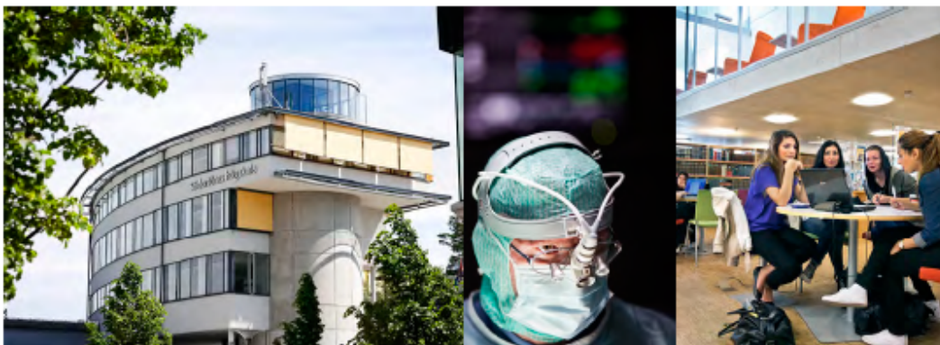
Figur 22: Innovativa miljöer