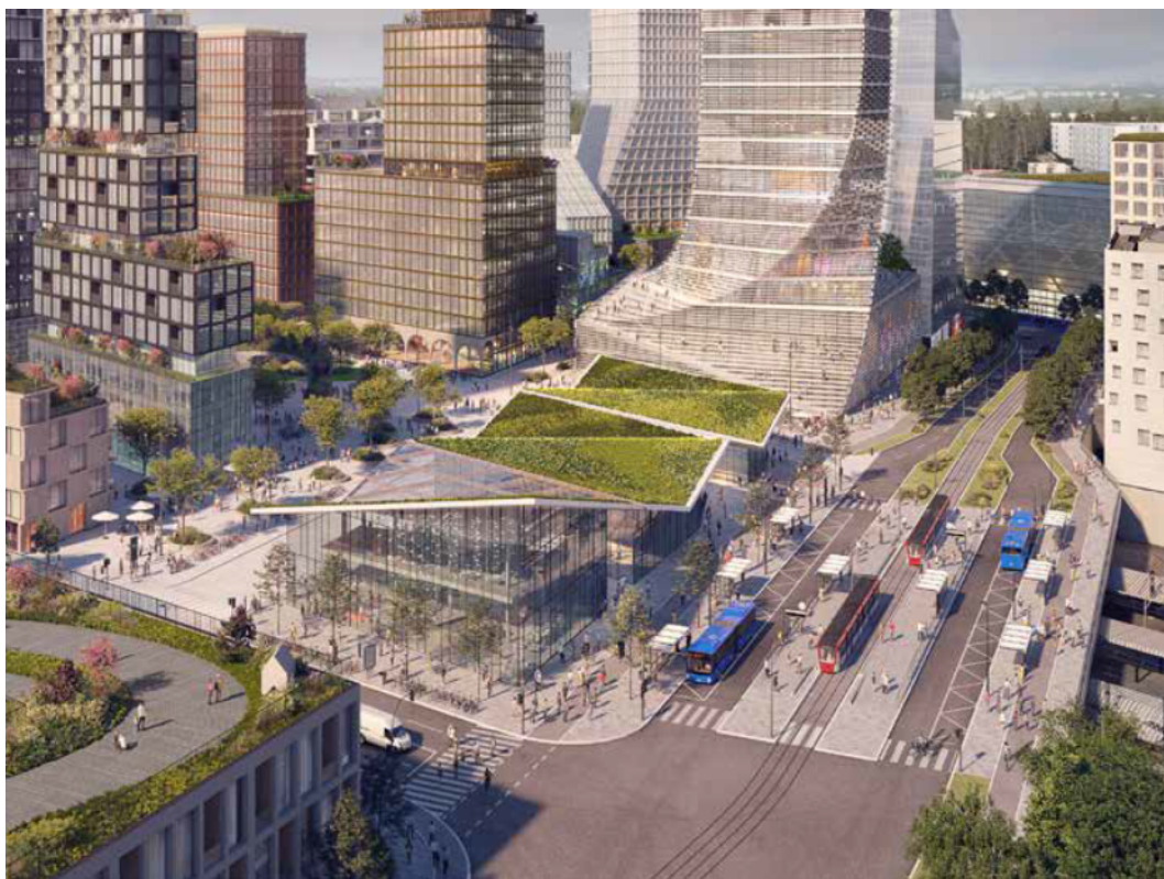
Visionsbild på resecentrum i Flemingsberg, en målpunkt i regionen.