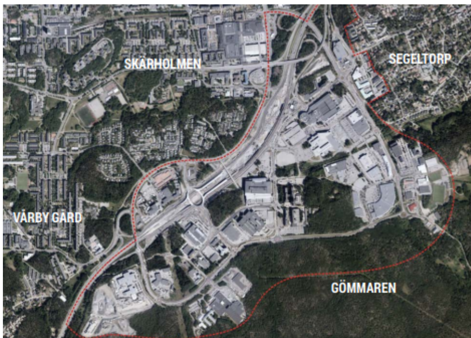
Utvecklingsplanens avgränsning med röd linje.

Kungens kurva är beläget cirka 15 km söder om Stockholms centrala delar, i den nordvästra delen av Huddinge kommun. Området omges av stadsdelarna Segeltorp i öster, Vårby i sydväst och Skärholmen i norr. I syd och sydost gränsar Kungens kurva mot Gömmarens naturreservat.