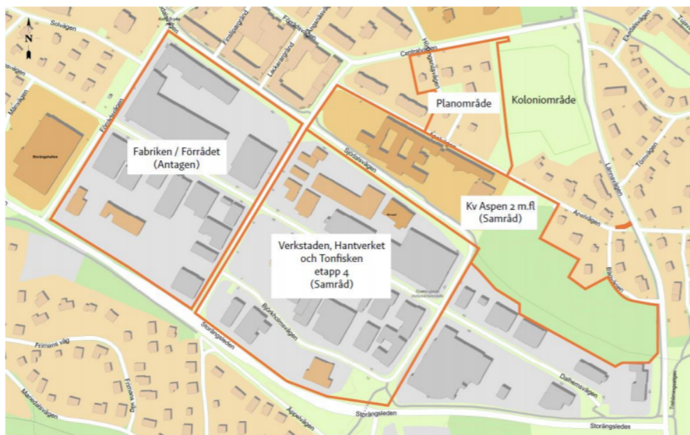
Tätortskarta som visar pågående detaljplaner i Storängen.

Ett genomförandeavtal ska upprättas mellan kommunen och exploatören och godkännas av kommunstyrelsen i samband med att detaljplanen antas.