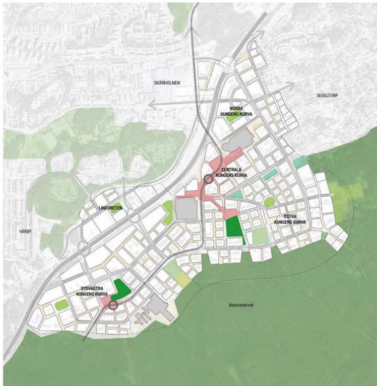
Diagrammet redovisar möjlig framtida bebyggelsestruktur för Kungens kurva, inklusive möjlig kvartersindelning.