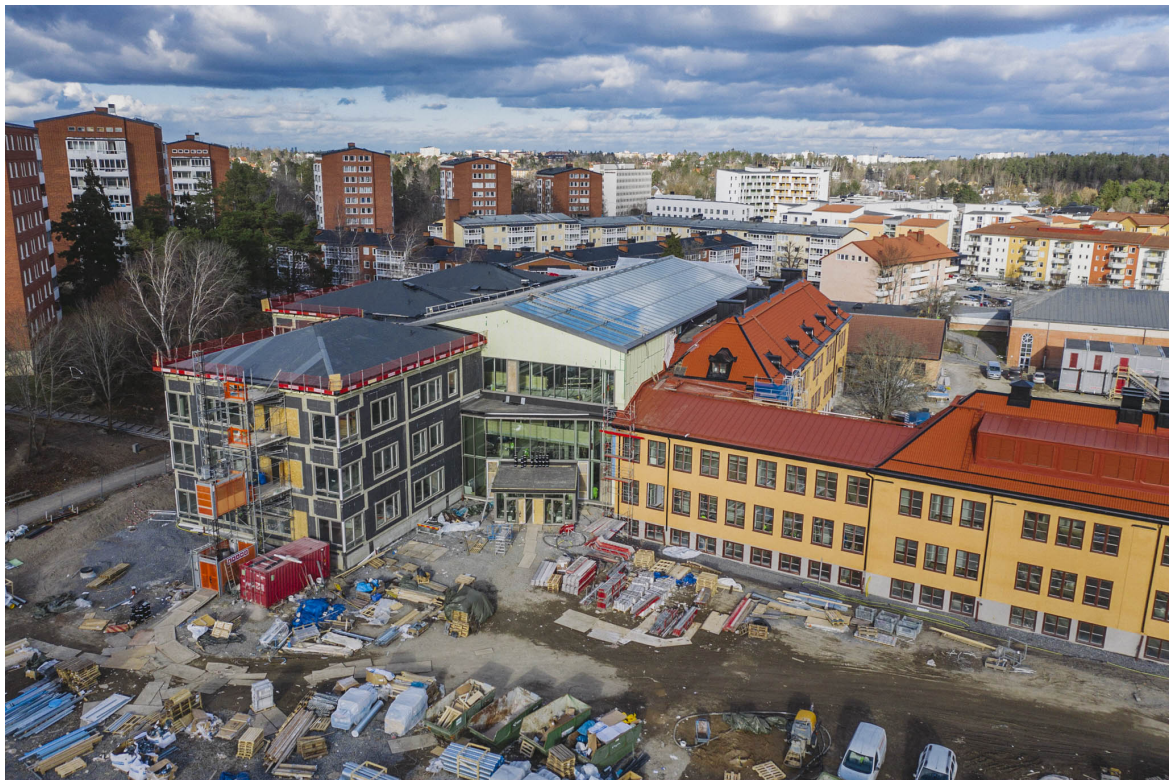
Tomtbergaskolan mars 2021, foto - Huddinge samhällsfastigheter