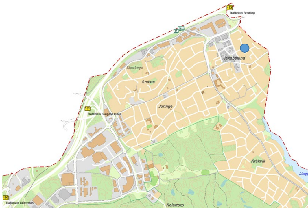
Fastighetens läge i Segeltorp kommunalsområde

Lägesbestämning, areal, markägförhållanden och markförhållanden