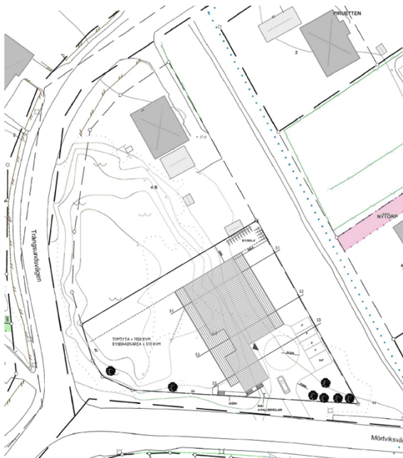
Förslag på husplacering