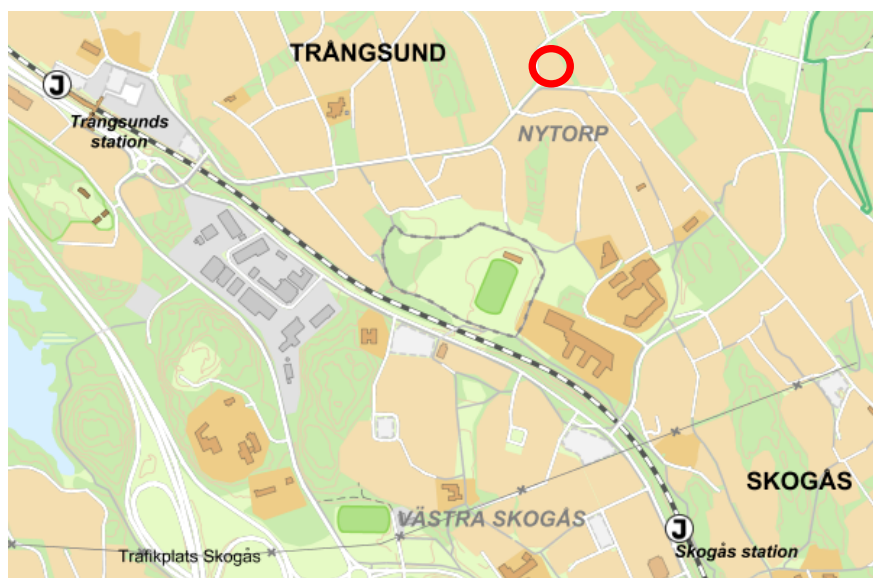
Översiktsbild över planområdet, markerat med röd ring.

Samhällsbyggnadsavdelningen bedömer att det är möjligt att pröva uppförande av ett fristående LSS-boende genom planläggning.