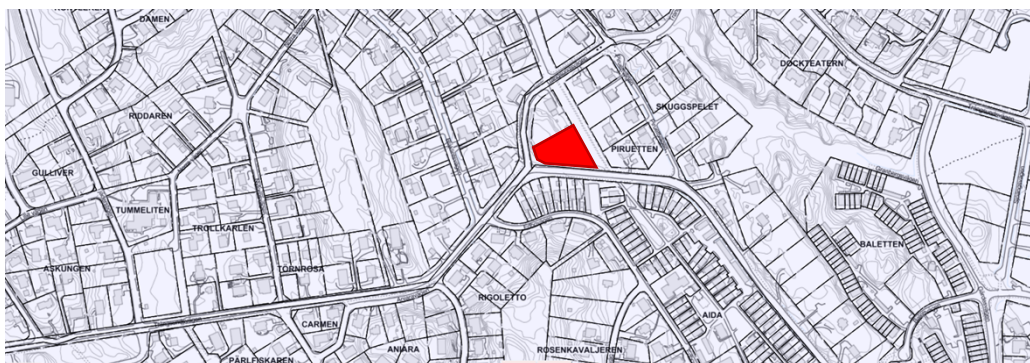
Översiktsbild över bostadsbebyggelse i närheten av planområdet

Planförslaget är förenligt med kommunens översiktsplan. Läget ger relativt goda förutsättningar att gå, cykla och utnyttja kollektiva färdmedel till och från boendet. Grannfastigheterna i området har en varierad bostadsbebyggelse med parhus, radhus men det är små tomter för enbostadshus som dominerar.