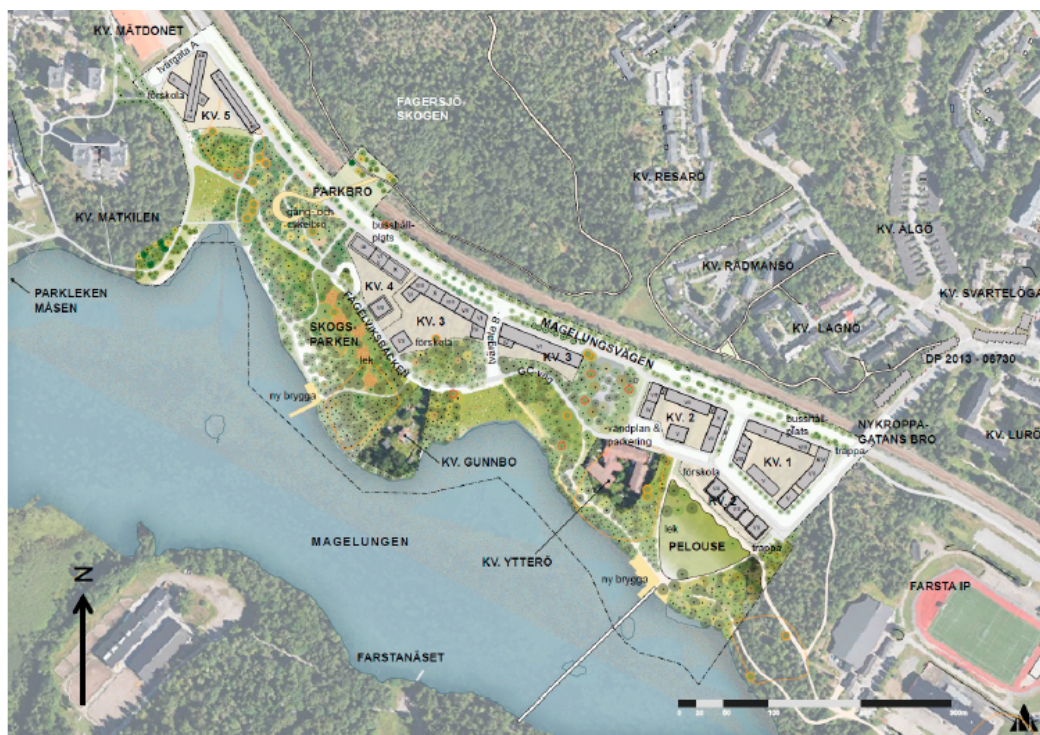
Situationsplan för planområdet.

Bebyggelsen består av tre grupper av sammansatta kvartervolymmer med varierande byggnadshöjder som är högre och slutna mot Magelungsvägen och öppna mot sjön. Mellan kvarteren bevaras naturmark som är en del av det ekologiska spridningsvägarna inom Hanvedenkilen. Magelungsvägen byggs om till en gata med stadskvaliteter med fortsatt god framkomlighet för regional trafik, med cykelstråk för cykelpendling, flera busshållplatser och möjlighet till lokaler i bottenvåningen. En ny gång- och cykelbro över Magelungsvägen och Nynäsbanan kopplar ihop Magelungens strand och Fagersjö med Fagersjöskogen och västra Farsta samt Högdalen.