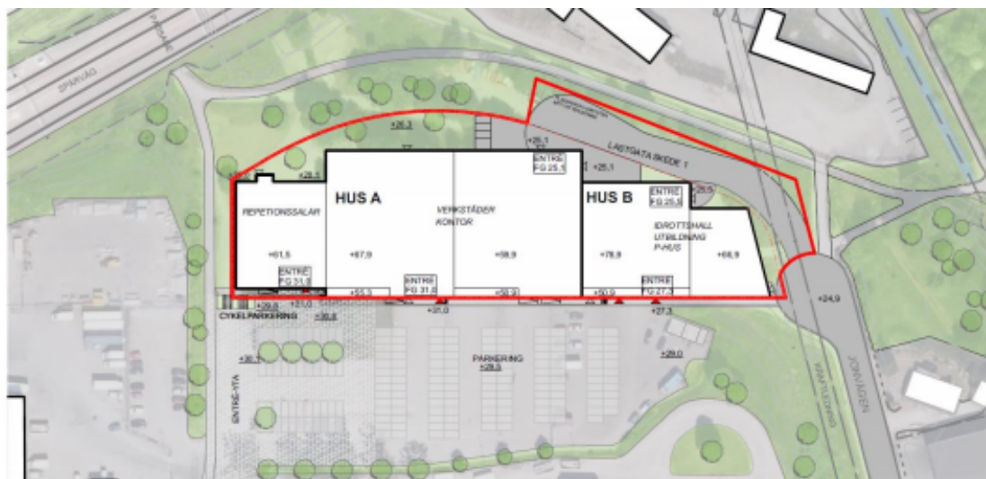
Situationsplan skede 1 (rådande förutsättningar på platsen) Illustration: Strategisk Arkitektur

Utöver detta möjliggör detaljplanen bebyggelse som inte är lika fastlagt i dess tänkta innehåll och programmering. Inriktningen är dock att övrig bebyggelse ska innehålla idrottsfunktioner såsom sporthallar för racketsport, basket eller motsvarande, skola i form av gymnasial utbildning, högskola eller annan högre utbildning, parkeringshus eller parkeringsgarage samt kontor. Denna del av bebyggelsen kallas nedan hus B. För den del av hus B som ligger längst i öster anges en genomförandetid som påbörjas senare eftersom bebyggelsen är tänkt att uppföras efter det att kraftledningen som angränsar i denna del av planområdet är markförlagd.