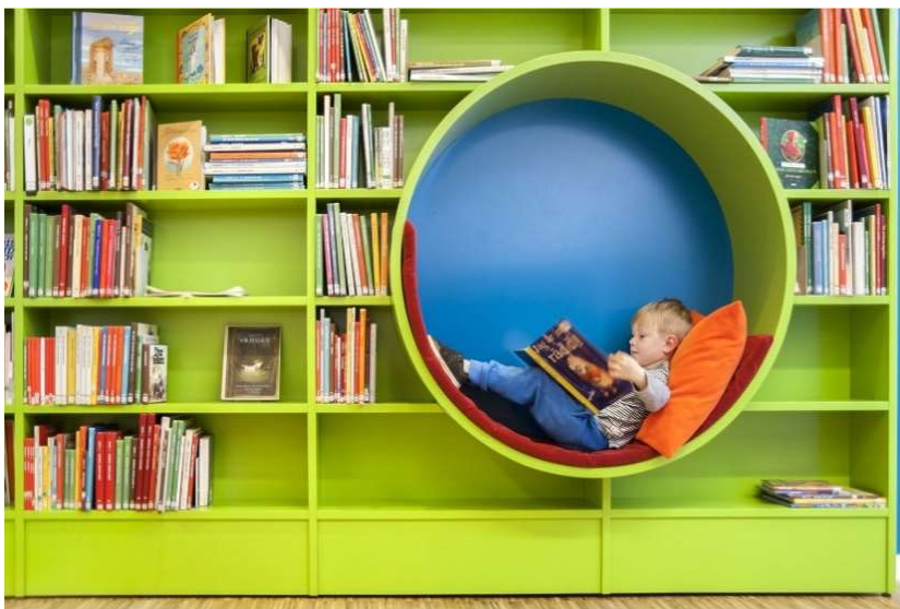
Inspirationsbild. Barnavdelning i Ystads bibliotek

Öppen yta med blandning av låga hyllor och boktråg, utspridda läsplatser enskilt och i grupp. Yta för de små barnen med medföljande föräldrar, eventuellt en småbarnspöl med skogräns.