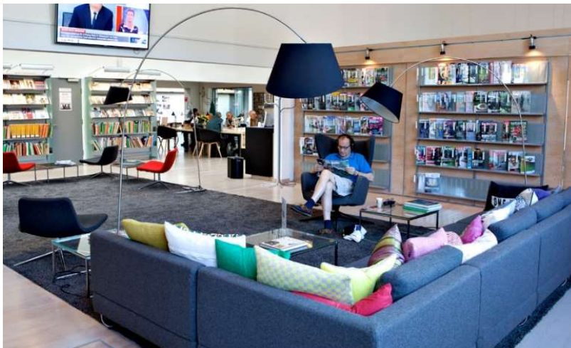
Inspirationsbild. Loungeområdet i Hillerød Bibliotek, Danmark

En zon har stolar kring ett större gemensamt bord. Detta är en mer arbetssignalerande miljö. Här finns ett högre behov av avskildhet och arbetsro. Det kan skapas med hjälp av rumsavskiljare, så som till exempel bokhyllor eller skärmar.