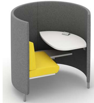
Inspirationsbilder på avskilda läs och studieplatser. Vänster: Karolinska Institutets bibliotek.

Några av de tysta studieplatserna kan vara avskärmade "rum i rummet", med glasade partier för insyn. För egna studier och mindre möten. Bokningsbara. Klassisk möblering med eluttag för egen laptop. Bra belysning.