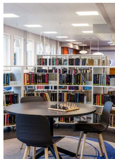
Inspirationsbild. Grue bibliotek, Norge

Placering med fördel i anslutning till ungdomsgårdsverksamhetens lokaler, vid en eventuell samlokalisering.