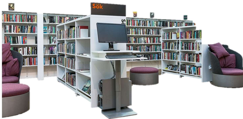
Inspirationsbild. Kista bibliotek

Bibliotekets användare ska kunna utföra flera funktioner på egen hand såsom låna och lämna tillbaka media, söka information, boka studieplats, dator mm. För detta finns flera hjälpmedel att tillgå. Tydligt skyltade platser ska finnas för 1-2 självbetjäningsautomater för utlån och återlämning. Återlämningsvagn, en eller två, finns bredvid. Dessa tjänster kan samlas centralt i biblioteket men nära entré och informationsdisken för lättillgänglig och snabb hantering. Här står även kopiator/skrivare för bibliotekets användare men även för personalen. Ytterligare en tjänst i biblioteksrummet är en katalogdator , som besökarna får använda för att söka efter böcker.