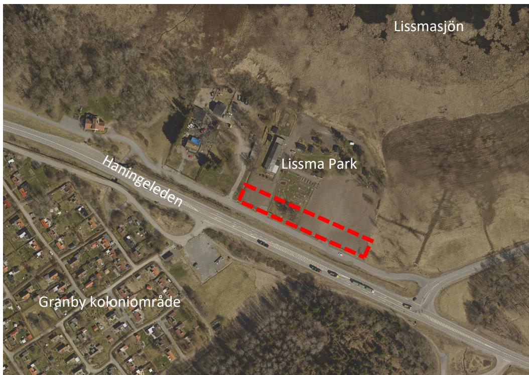
Figur 1: Flygfoto över berört område. Upphävandets ungefärliga avgränsning markerat i rött.