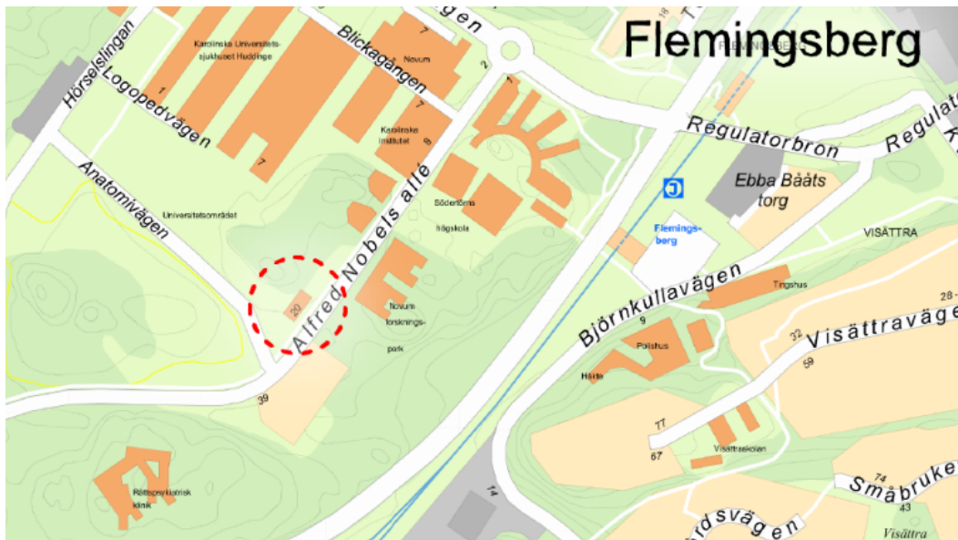
Bild 1. Översiktskarta där röd streckad linje visar ungefärligt planområde.

Enligt projektets preliminära tidplan kan detaljplanen antas under kvartal 2 år 2021.