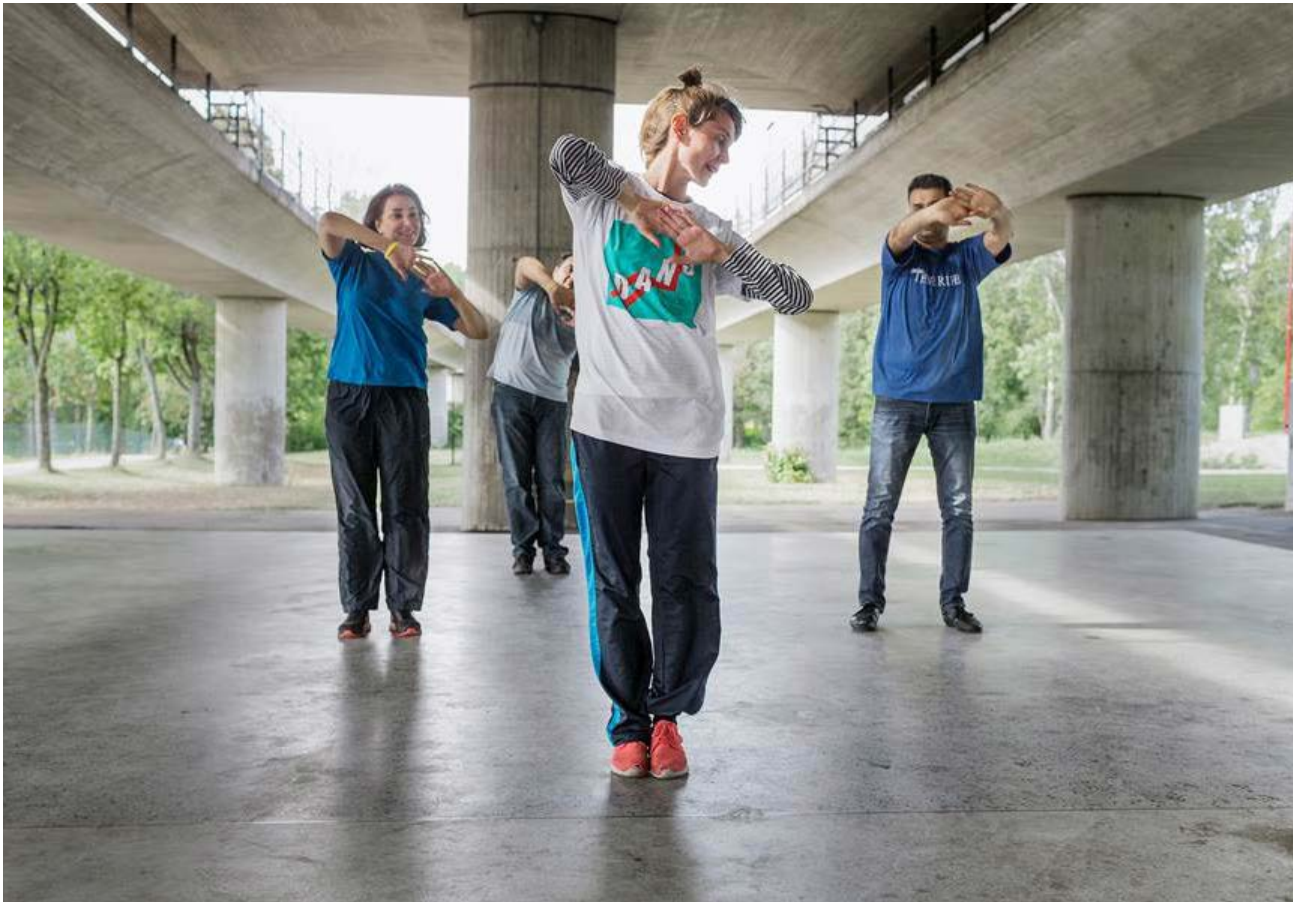
Vårby Gård