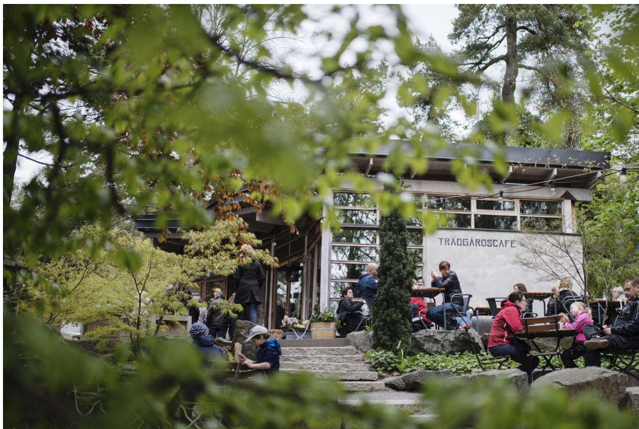
Zetas Trädgårdscafé