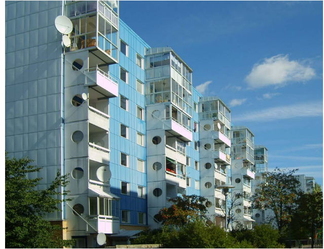
Grantorp i Flemingsberg