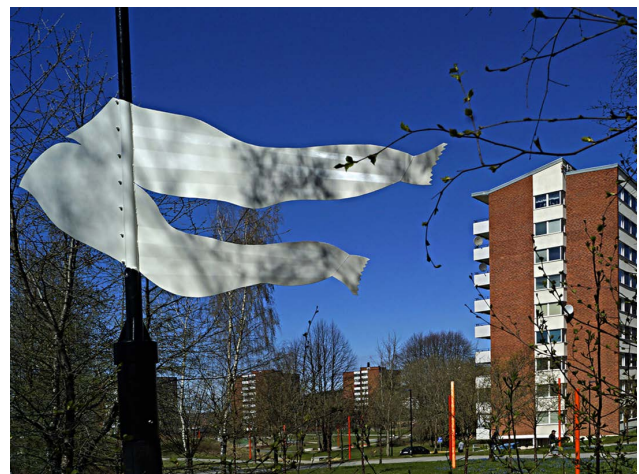
Konstverk och vägvisare till Tvätterimuseet

Begreppet kulturmiljö omfattar hela den av människan påverkade fysiska miljön. Kulturvärden kan i varierande grad tillskrivas enskilda byggnader, anläggningar och lämningar såväl som hela miljöer och stora landskapsavsnitt. Det är inte alltid som bevarande av kulturhistoriskt värdefulla platser och byggnader går hand i hand med den tänkta utvecklingen av ett område. Bevarande vägs till exempel mot behov av fler bostäder, bättre service, förbättrade sociala möjligheter eller en modernisering av verksamheter. Vid stadsutveckling är det viktigt att försöka se kulturmiljön som en resurs till det nya området och inte som ett hinder.