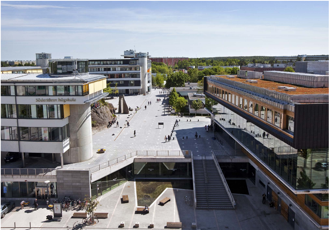
Södertörns Högskola