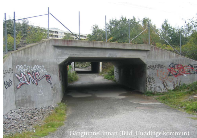
Gångtunnel innan

Ta hand om och rusta upp i befintliga områden Klotter, nedskräpning och trasig belysning kan skapa en känsla av att platsen inte är omhändertagen. Vid komplettering i befintliga områden ska också befintliga fasader och utemiljöer tas om hand. Den befintliga och den nya bebyggelsen ska kännas som en helhet.