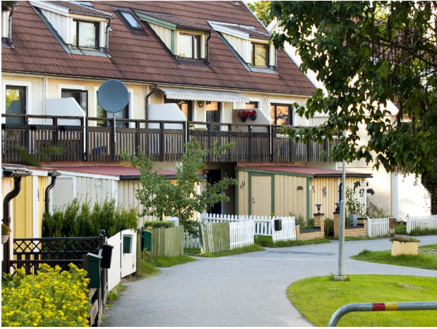
Skogås, (Bild: Thomas Henriksson)