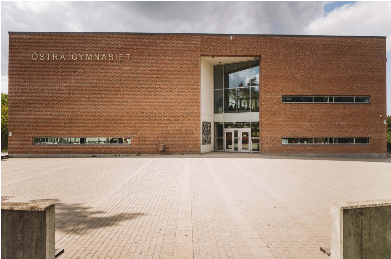
Östra gymnasiet

Byggnader som närboende och andra har koppling och tillgång till skapar gemensamma värden samt stolthet.