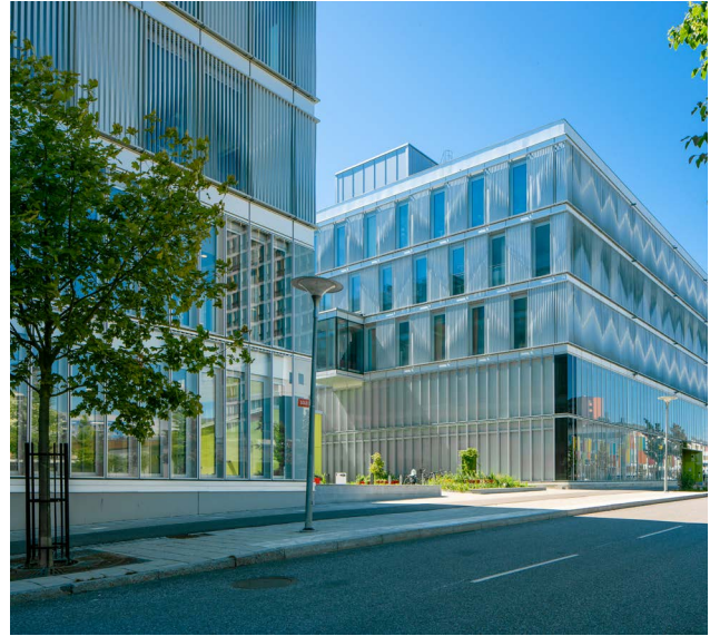
Technology and Helth, Flemingsberg