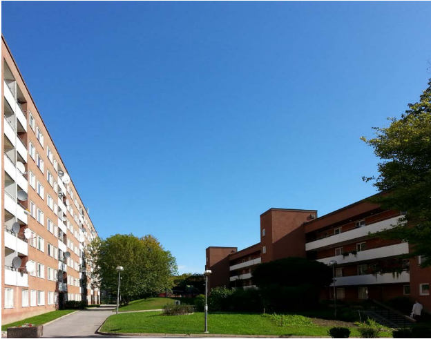
Värby Gård