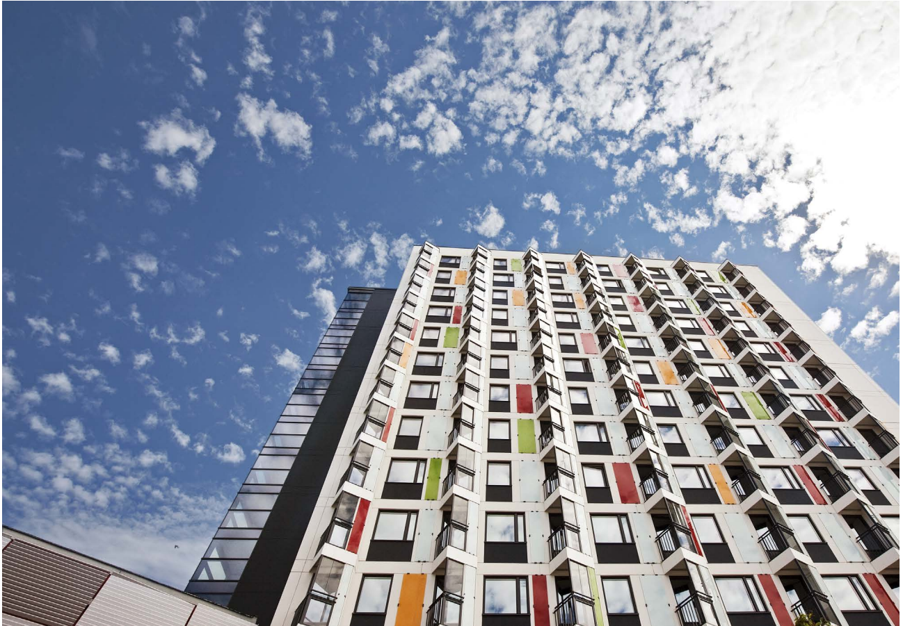
Studentskrapan i Flemingsberg