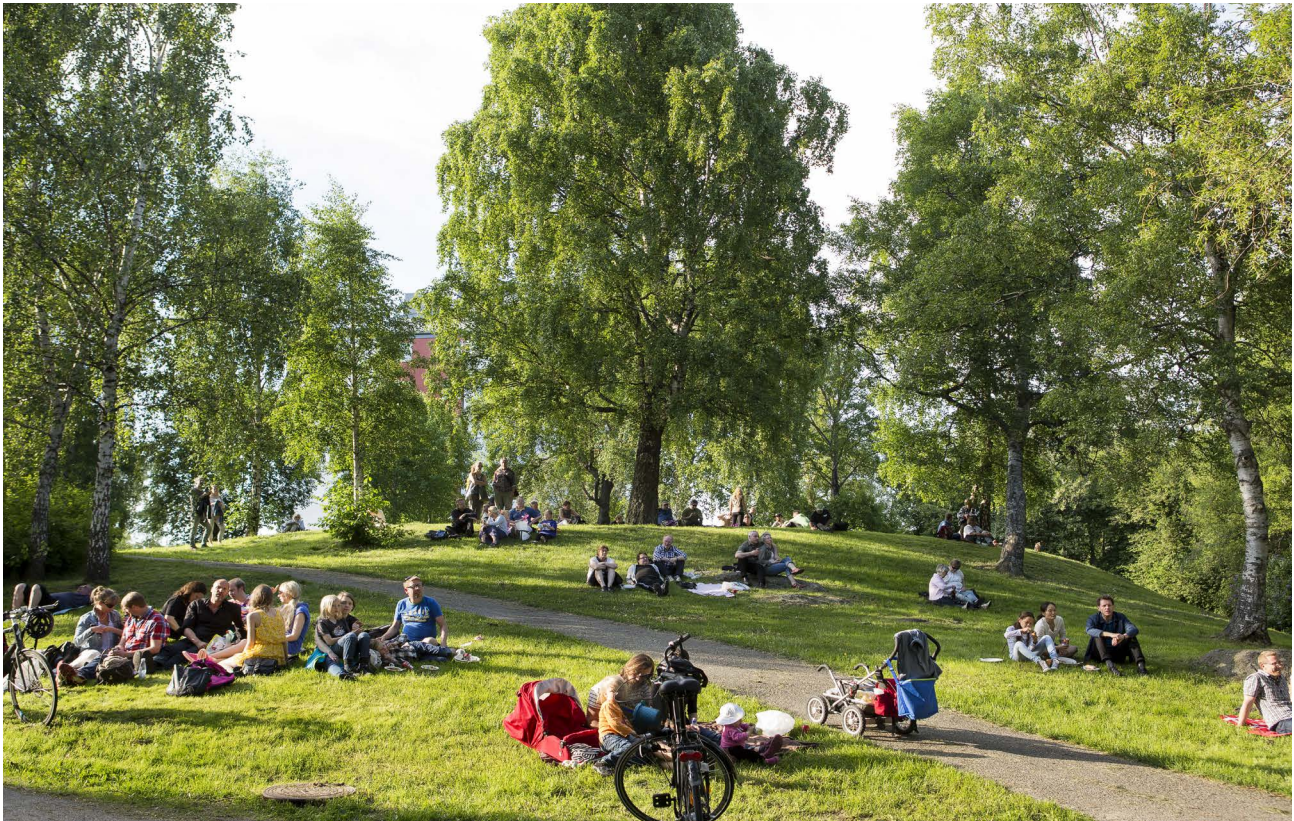
Sjödalsparken, (Bild: Mattias Malm)