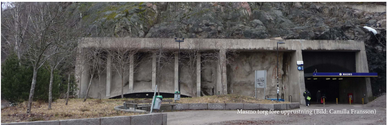
Masmo torg före upprustning