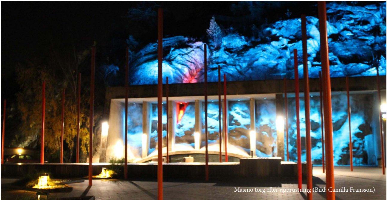
Masmo torg efter upprustning