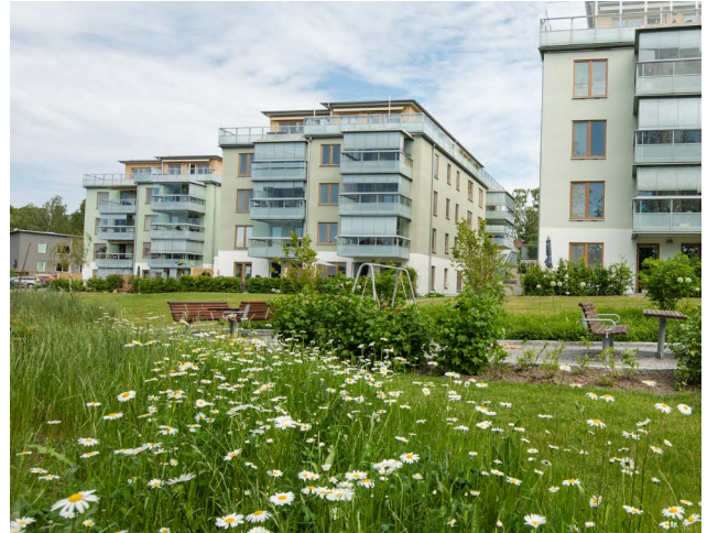
Kvarteret Gulsparven

Puts och tegel är vanligast som fasadmateriäl. Trä- och smidesdetaljer är vanligt och ibland förekommer plåt i balkongräcken och tak.