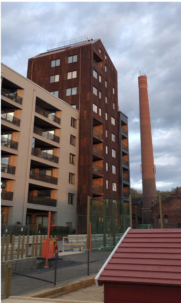
Norra Djurgårdsstaden

Prioritera stadsrummets användbarhet och kvalitet. När tätheten ökar blir det särskilt viktigt att planera gårdar och stadsrum optimalt. Dessa kommer att användas flitigt och många ska samsas om ytorna. Parker, torg och stadsgator planeras för att vara användbara för flera målgrupper och aktiviteter. Den kanske viktigaste kvaliteten i vårt klimat är att platser är solbelysta, vilket bestäms av väderstreck och byggnadshöjder. Stadsrummen bör också skyddas från buller.