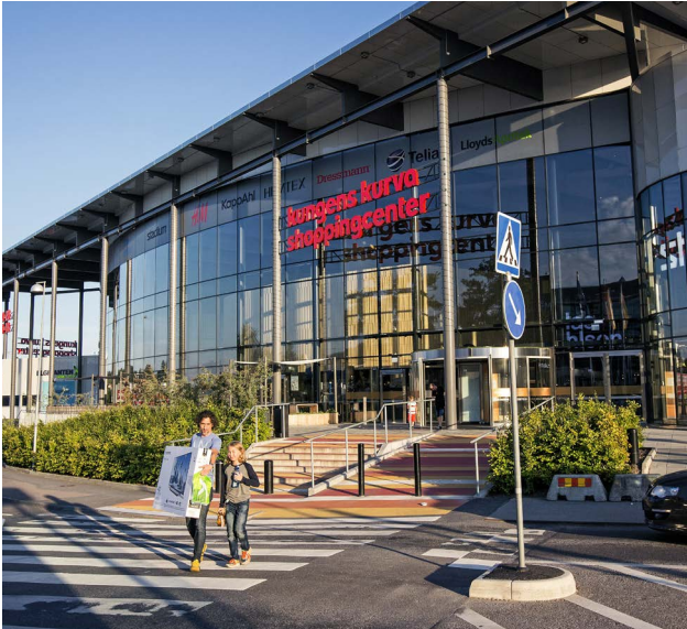
Kungens Kurva