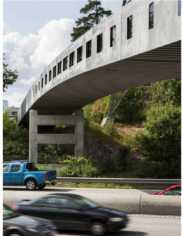
Gång- och cykelbro

Huvudgator inom bebyggelseområden har ibland ut-