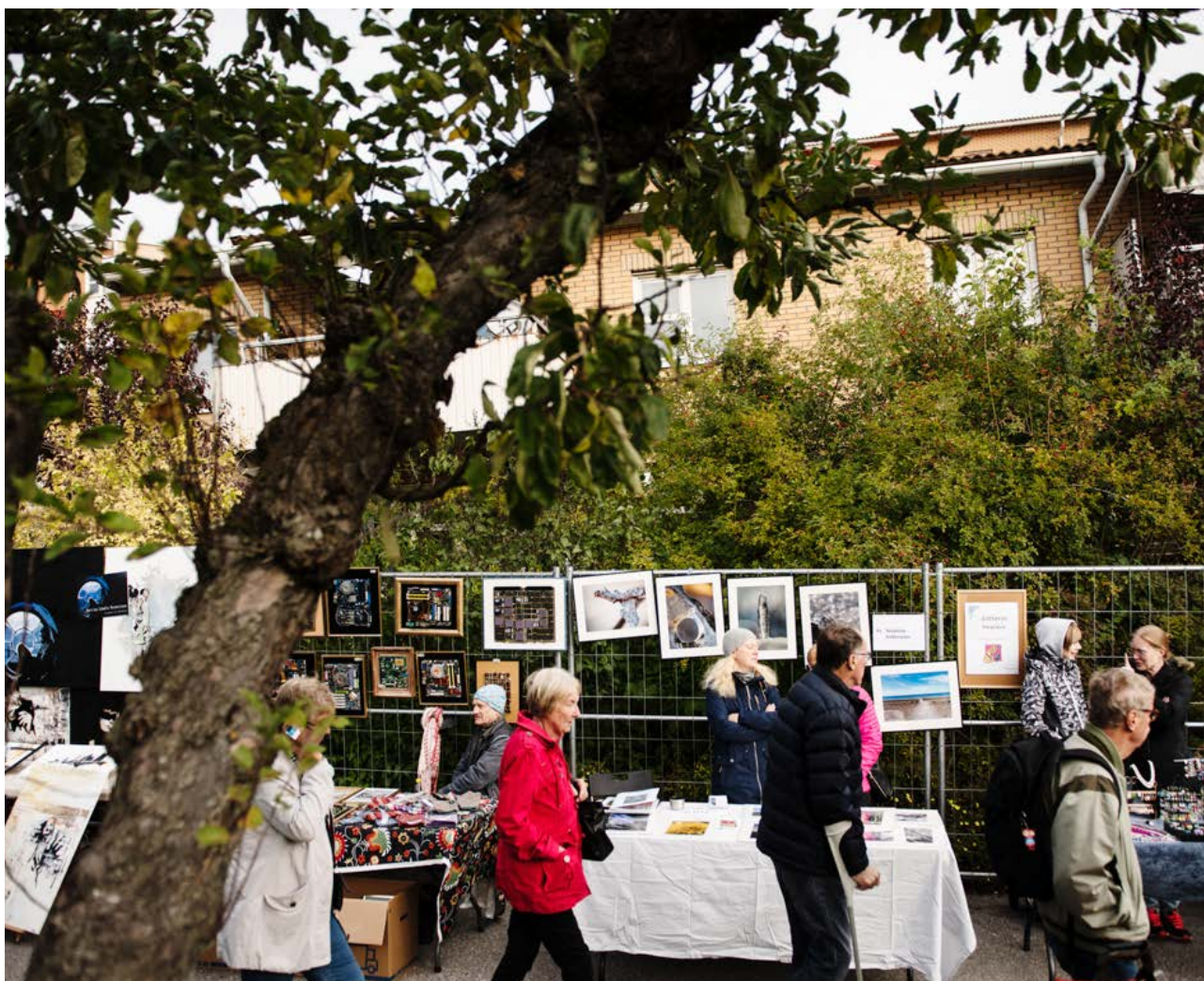
1000 meter konst

I det hållbara samhället, ur demokratiska, sociala och ekologiska aspekter, har kulturen en bärande roll. Stadsrummen bör innehålla konstupplevelser och inspirera till lek och kreativitet. Konst ger identitet och karaktär till platsen, är intresseväckande och kommunikativ. Konst i stadsrummet är också ett sätt att tillgängliggöra konsten för fler. Investeringar i konst bör uppmuntras i varje byggprojekt.