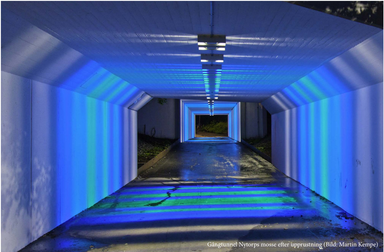
Gångtunnel Nytorps mosse efter upprustning