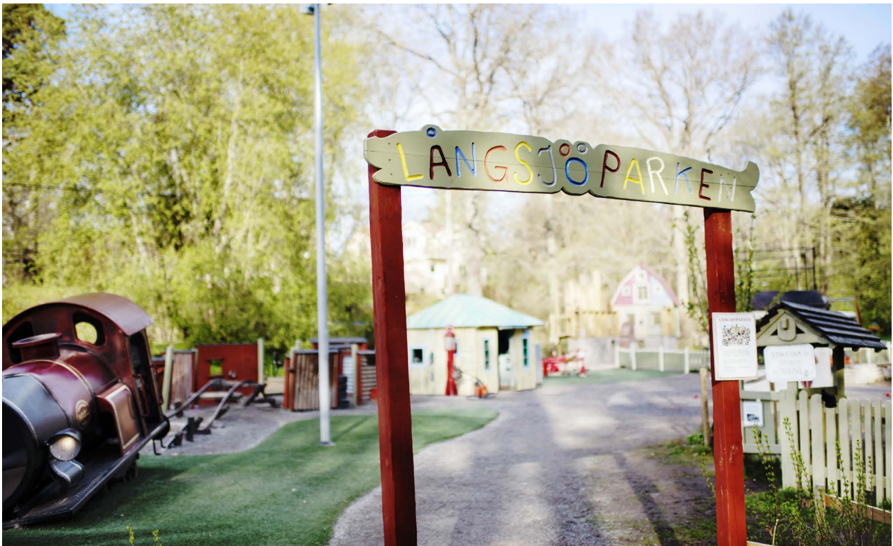
Långsjöparken (Bild: Maja Brand)