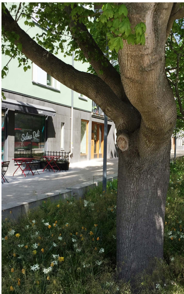
Norra Djurgårdstaden

Olika typer av grönska beroende på täthet I de mer tätbebyggda områdena är det viktigt att tillföra grönska och utnyttja alla de ytor som finns, samt höja kvaliteten på den befintliga grönskan. I nya större områden ska parker pekats ut. Stadsodling, bostadsgårdar, gröna stråk, blomprakt på torg och gator, gröna tak och fasader, öppna dagvattenlösningar och vattenlek är exempel på möjlig grönsstruktur. Vid utformning av grönytor ska barnperspektivet beaktas. Variation i vegetation och terräng ska stimulera till lek- och aktivitetsmiljöer för barn i alla åldrar.