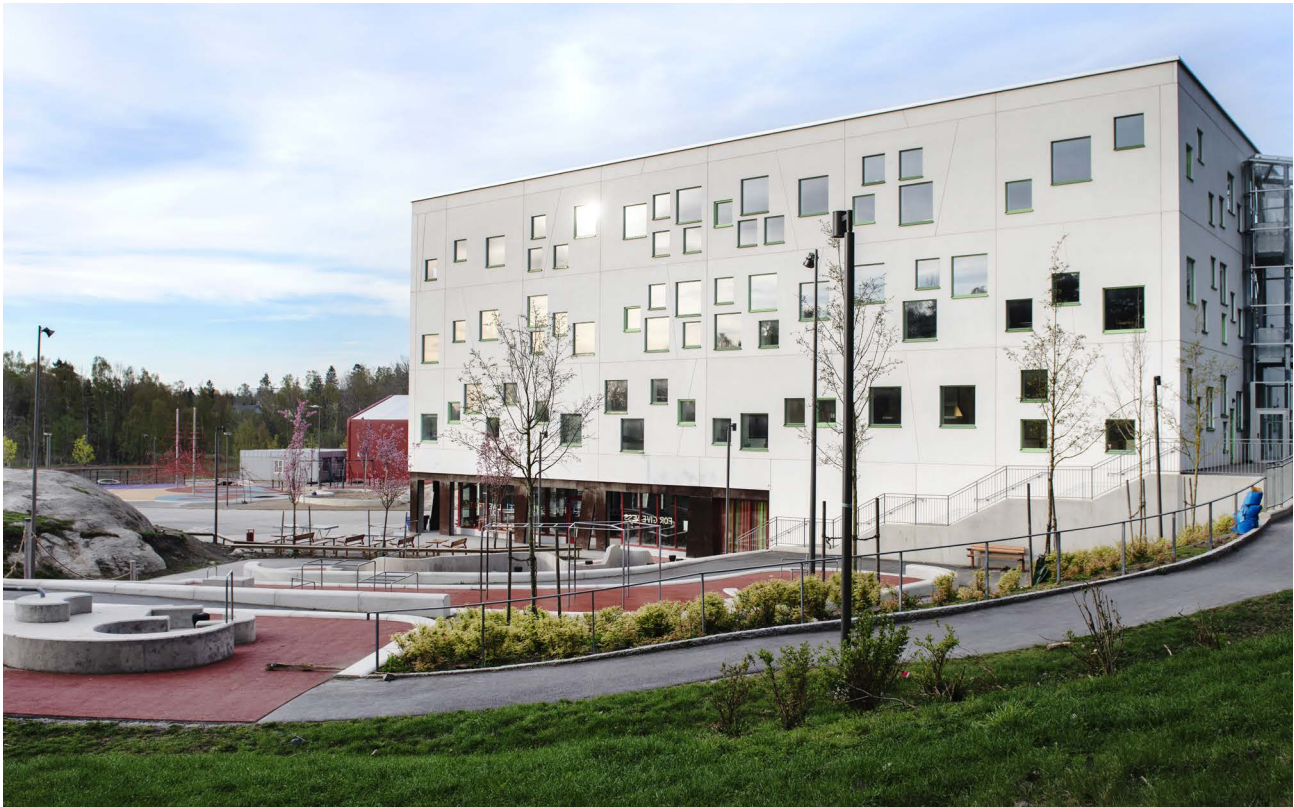
Glömstaskolan, (bild: Maja Brand)