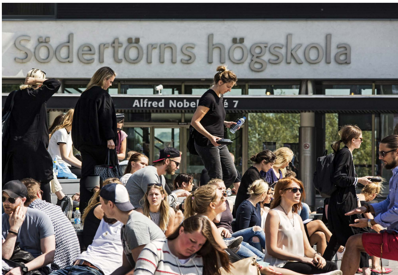
Södertörns Högskola