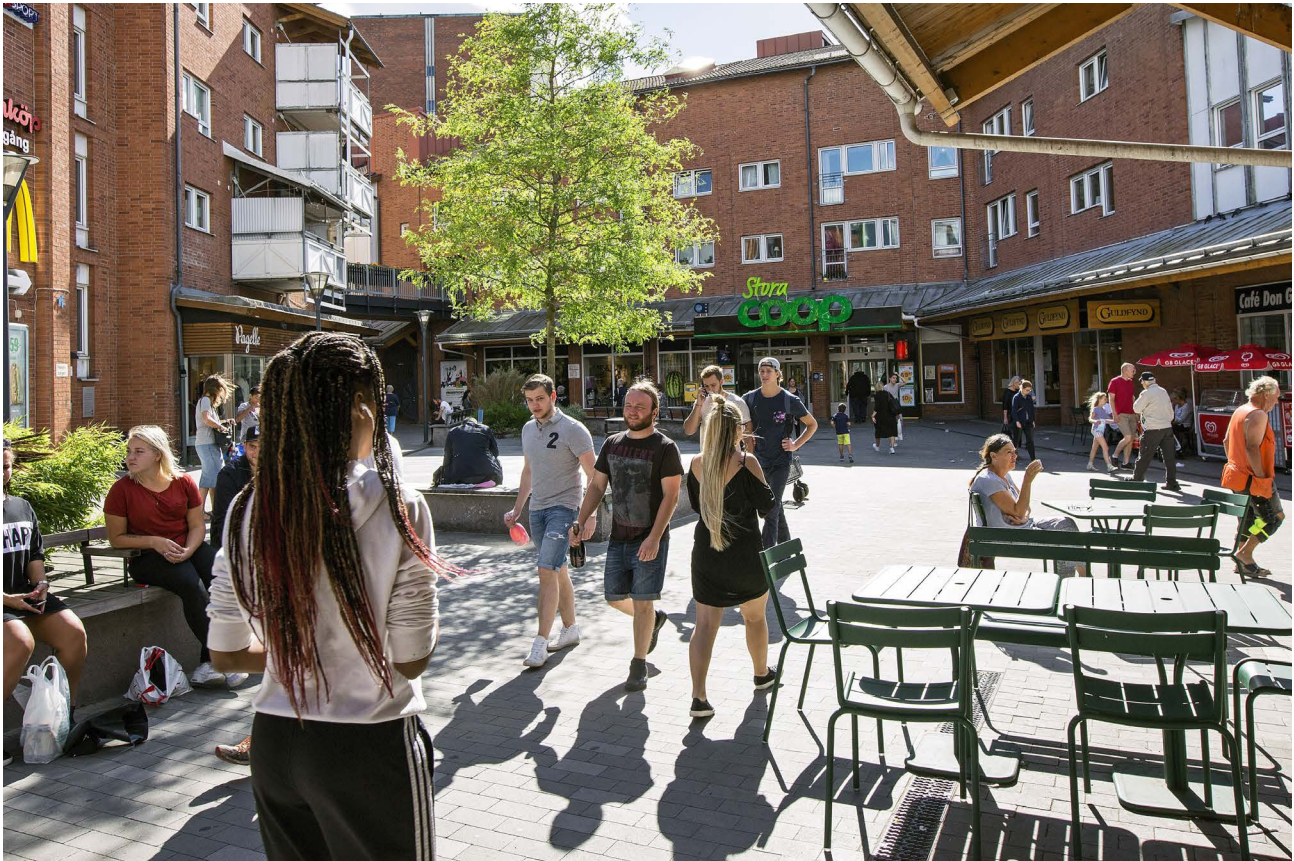
Huddinge centrum