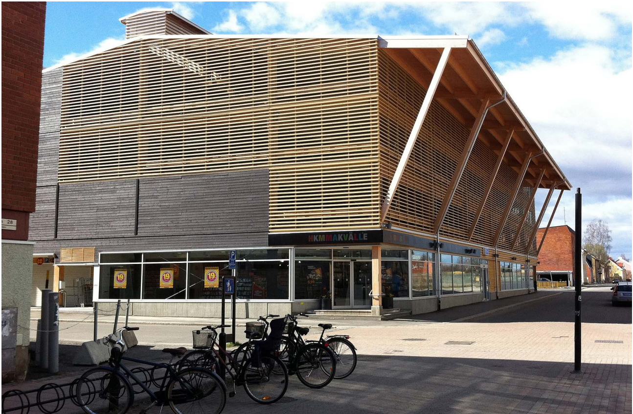
Parkeringshus i massiv- och limträ, Skellefteå av AIX Arkitekter