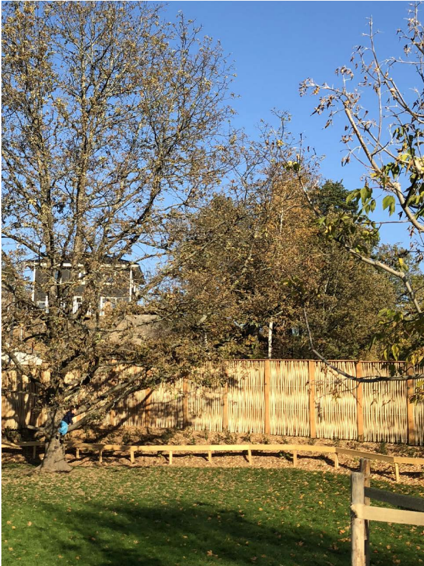
Bullerplank Ängsnäs