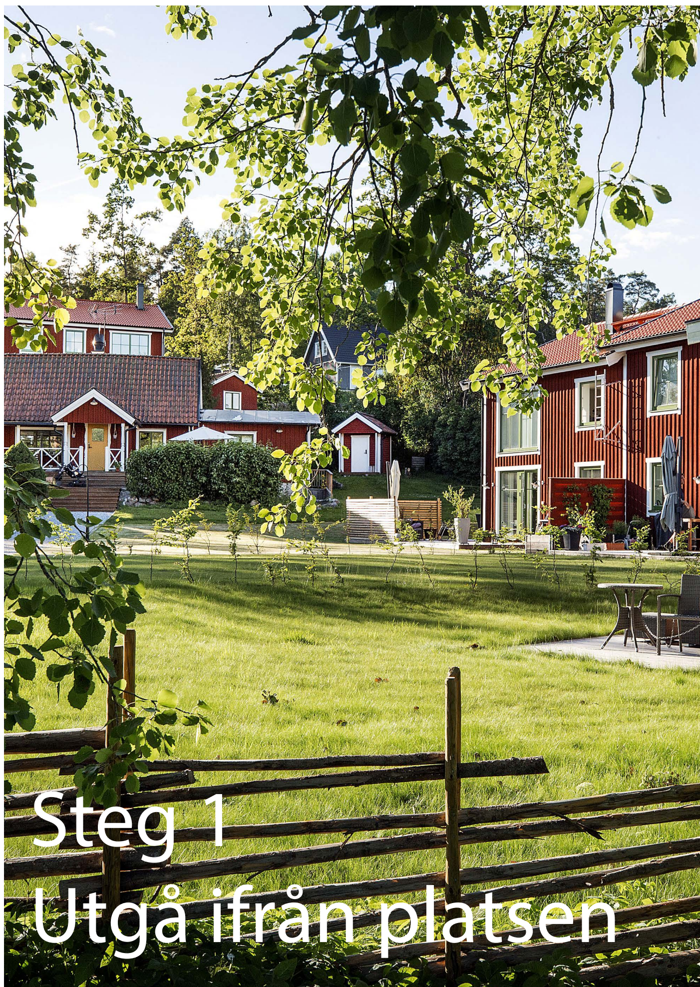
Gretas Backe