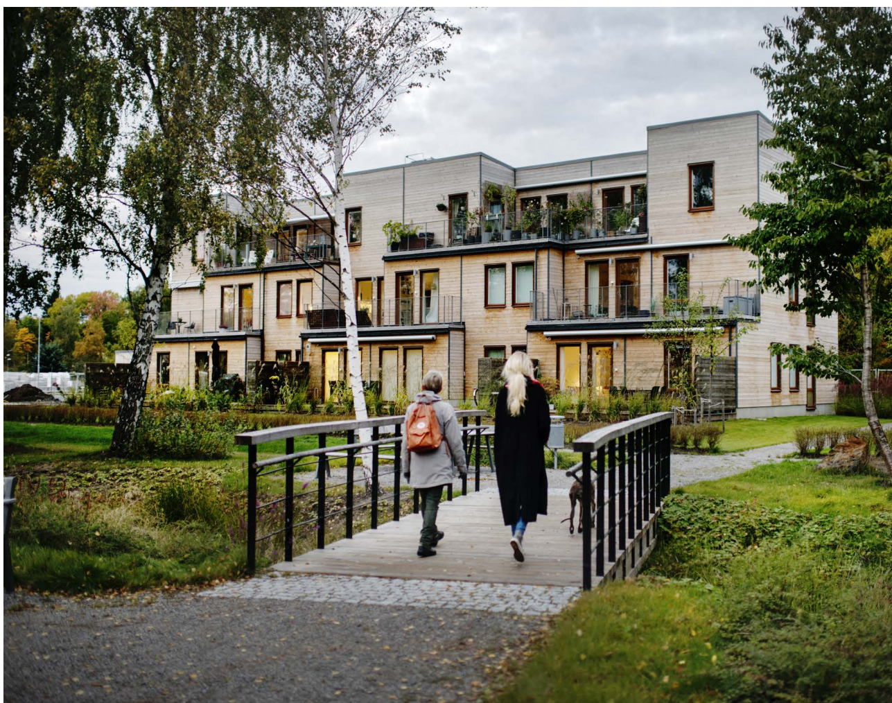
Ängsnäs glänta, (Bild: Maja Brand)

Arkitektur handlar inte enbart om hur ett hus ser ut, vilken fasad det har eller om det anses vara fult eller vackert. Arkitektur handlar om utformandet av vår fysiska miljö, om byggnaderna men också rummen mellan husen. Arkitekturen handlar om siluetter, siktlinjer, kulör och fasadmateriell. Arkitektur handlar dock framförallt om vilken upplevelse och känsla man får i den bebyggda miljön. Arkitekturstrategin ska kunna ge svar på vad det är som egentligen spelar roll samt resonera om vad som genererar arkitektonisk kvalitet. Till stor del handlar det om god planering och framförhållning.