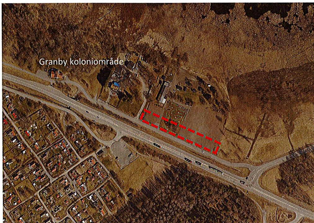
Figur 4: Flygfoto över berört område. Upphävandets avgränsning markerat i rött.

Inom berört område finns inga utpekade natur-, kultur- eller rekreationsvärden.