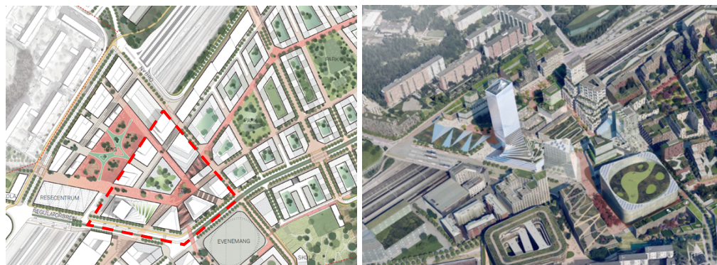
Illustrationer över aktuellt planområde. Planområdet är markerat med rött. Avgränsningen är preliminär.