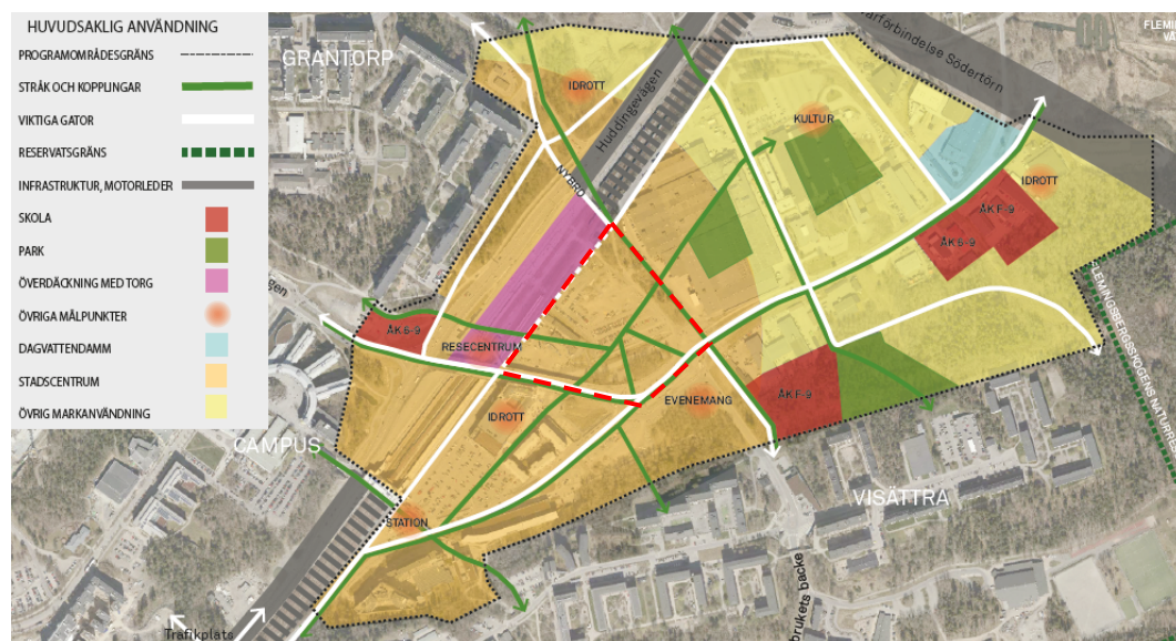
Programkarta som visar huvuddragen i planprogram för Flemingsbergsdalen. Planområdet är markerat med rött. Avgränsningen är preliminär.

Planprogrammet för Flemingsbergsdalen tar avstamp i utvecklingsprogrammets vision för hela Flemingsberg. Planprogram för Flemingsbergsdalen godkändes den 20 april 2020 av kommunfullmäktige och visar en intention om att utveckla ny bebyggelse med framförallt kontor.