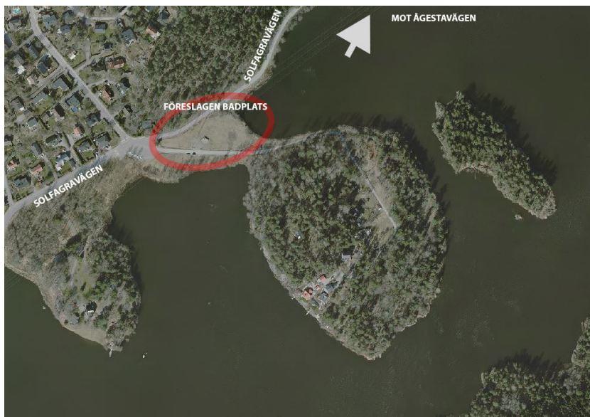
Fig. 1. Bilden visar den plats intill en vändplan, där förslagsställaren önskar en badplats.